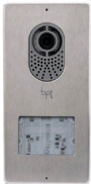
LVC/01 AP Video-Audio Aussensprechanlage

Starterkit / Einfamilienhauskit enthält: