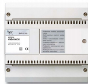
VAS/100.30 Netzgerät Versorgung Innen- und Aussensprechanlage